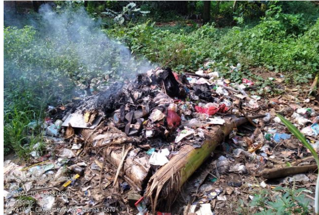
Gambar 2. Tempat Pembuangan Sampah

Adanya perilaku membuang sampah sembarangan menyebabkan banyaknya sampah di lingkungan permukiman. Sehingga dapat mengganggu kenyamanan dalam beraktivitas di lingkungan permukiman, kesadaran masyarakat terhadap lingkungan masih sangat rendah sehingga permasalahan sampah masih dipandang remeh. Perilaku seseorang dapat dibentuk ketika mendapatkan pengaruh dari sikap orang lain, namun hal ini tidak dapat dilakukan secara langsung karena perilaku seseorang dipengaruhi oleh sejumlah faktor pendukung, seperti fasilitas, pengalaman, motivasi, dan lingkungan (Benani et al., 2022). Hal ini yang terjadi di Desa Cikopomayak dimana tidak adanya ketersediaan fasilitas – fasilitas atau sarana pengelolaan sampah yang memadai sehingga berdampak pada perilaku masyarakat yang kurang baik terhadap pengelolaan sampah di Desa Cikopomayak yang sebagaimana terlihat pada gambar 2.