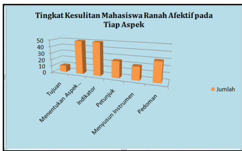
Gambar 1. Tingkat Kesulitan Mahasiswa Menyusun Instrumen Penilaian Afektif

Analisis kesulitan tersebut secara ringkas disajikan pada bagan berikut: