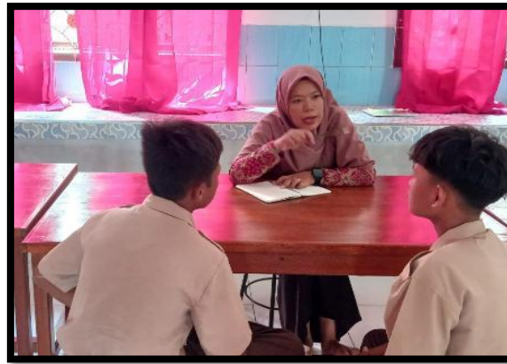
Gambar 2. Wawancara dengan Peserta Didik Kelas VIII

Tahap kedua yakni desain, Pembuatan bahan ajar “SIDA DAMAN” dengan pendekatan STEM ini dilaksanakan dengan menciptakan desain melewati aplikasi Canva yang di cetak guna dipakai murid selaku materi pembelajaran. Tahapan pertama dengan merancang materi pembelajaran sesuai dengan STEM. Adapun konten bahan ajar dengan pendekatan STEM terdapat pada tabel 3.