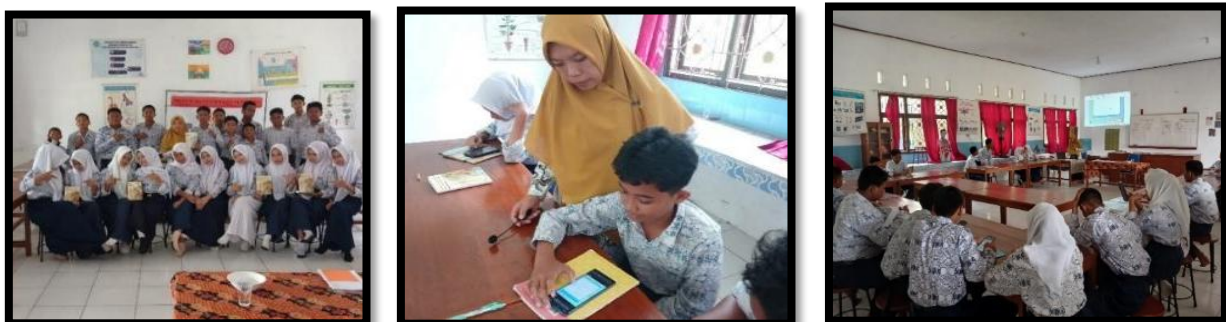
Gambar 5. Penerapan Pembelajaran Skala Besar di SMPN 5 Pangkalan Banteng

Hasil angket tanggapan skala besar mendapatkan respon positif dari murid. Berlandaskan temuan yang didapat dengan persentase 92,83% dengan kriteria "Sangat Praktis". Hal ini selaras studi Al Fadli et al., (2024) tampilan mading yang menarik maka akan meningkatkan literasi peserta didik. Berikut dokumentasi implementasi skala besar, pada hari Kamis, 23 Oktober 2025.