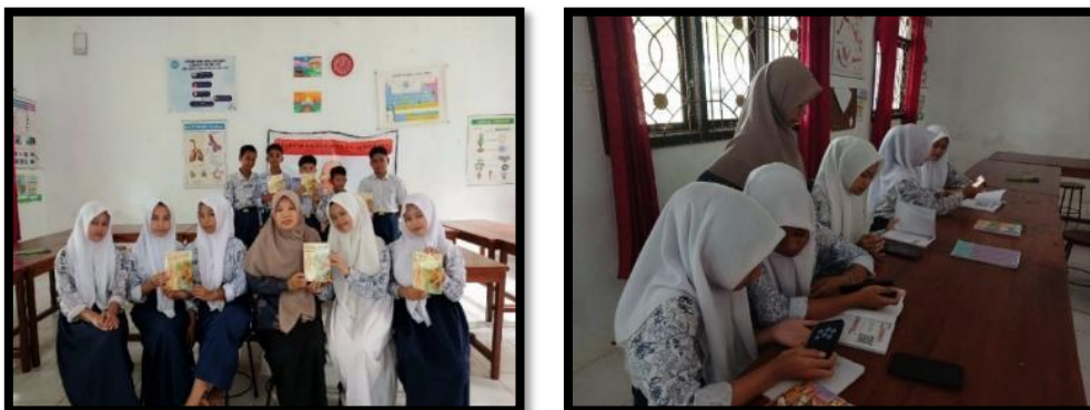
Gambar 4. Penerapan Pembelajaran Skala Kecil di SMPN 5 Pangkalan Banteng

Berdasarkan Tabel 9, bisa ditarik simpulan bahwa hasil angket tanggapan murid dalam tahap uji coba skala kecil terhadap bahan ajar "SIDA DAMAN" dengan pendekatan STEM memperoleh respons yang positif. Hasil pengolahan data menunjukkan persentase sebesar 97,77% peserta menilai bahan ajar tersebut sebagai "Sangat Praktis". Berikut disertakan dokumentasi implementasi uji coba skala kecil yang dijalankan di hari Rabu, 22 Oktober 2025, pada jam ke-4 hingga ke-5.