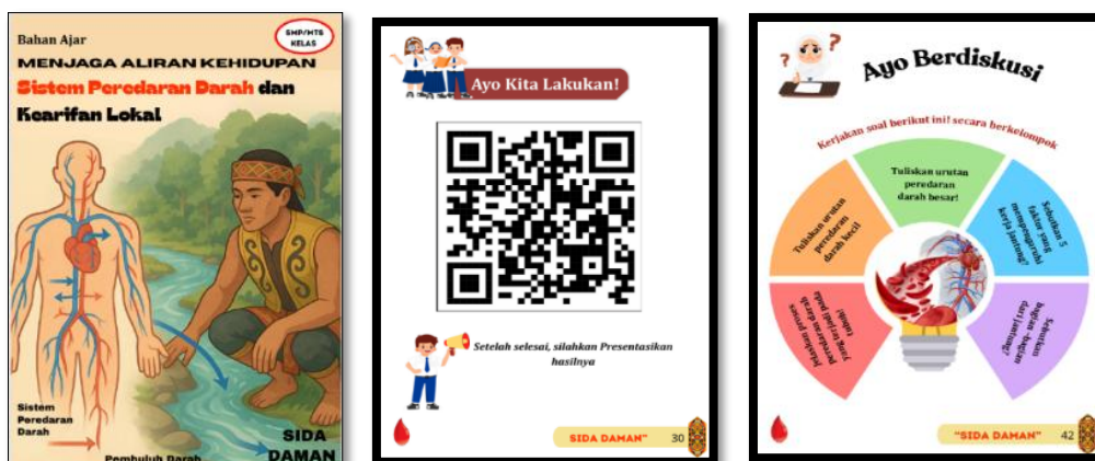
Gambar 3. Tampilan bahan ajar “SIDA DAMAN” dengan pendekatan STEM

Selanjutnya, pada tahap pengembangan, aktivitas yang dijalankan melingkupi pembuatan media aktivitas belajar berupa bahan ajar “SIDA DAMAN” dengan pendekatan STEM menggunakan platform Canva dan Quizizz. Bahan ajar yang sudah dirangkai kemudian divalidasi tiga validator yang merupakan pakar di bidangnya, yakni dosen ahli materi, dosen ahli media, dan dosen ahli bahasa. Hal ini sejalan pernyataan Okpatrioka, (2023) bahwa produk yang dikembangkan melewati studi mesti melalui serangkaian uji kelayakan oleh para ahli agar temuannya bisa dipertanggungjawabkan. Proses validasi ini mempunyai tujuan guna mendapat masukan, kritik, juga saran konstruktif dari para pakar. Tujuan pokok tahap ini ialah untuk menyempurnakan produk awal dan memastikan bahwa bahan ajar “SIDA DAMAN” dengan pendekatan STEM yang disusun sudah memenuhi standar kualitas yang diharapkan.