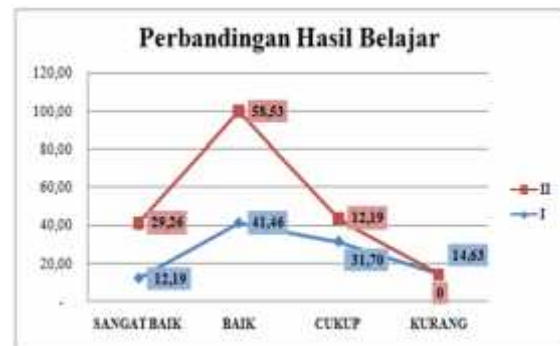
Gambar 2. Distribusi dan kategori nilai hasil belajar siswa kelas XII Bahasa MAN 1 Watampone pada siklus I dan II

Dari hasil belajar yang dicapai pada siklus II menunjukkan adanya keberhasilan dari penerapan Model Pembelajaran Membaca Text Narrative dengan Teknik KWLA ( What I Already Know, What I Want To Know What I Learned, and The Affect of The Story ). Data hasil belajar siswa Kelas XII Bahasa MAN 1 Watampone mata pelajaran Bahasa Inggris menunjukkan ketuntasan belajar klasikal 85% tercapai. Ada 13 orang atau 92,85% siswa berada pada kategori tuntas belajar, sehingga tindakan tidak perlu dilanjutkan pada siklus berikutnya. Distribusi jumlah siswa dan persentase hasil belajar siswa dapat dilihat pada gambar 2 berikut: