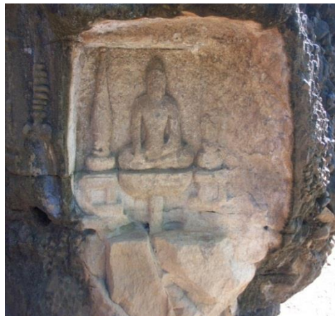
Gambar 3.3. Pahatan relief bentuk Patung Budha

Pada pahatan relief bentuk patung budha ini memiliki hiasan pada samping kiri dan kanan berbentuk stupa dan pada bagian dasar stupa tersebut terdapat ornamen berbentuk geometris (persegi) dan menurut literature yang saya peroleh patung budha ini duduk diatas bunga Padma bertangkai. Relief patung budha ini adalah adalah salah satu relief yang dipugar pada tahun 1998.