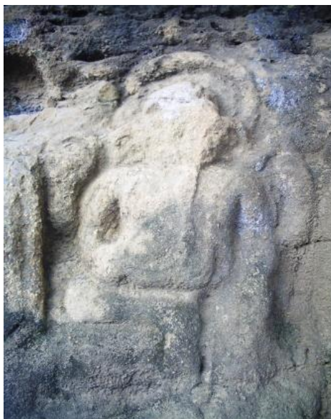
Gambar 3.1. Pahatan relief bentuk Ganesha (Dokumentasi: Sulfahri, 19 Mei 2019)

Relief Ganesha ini terdapat pada lokasi Situs Wadu Pa'a II yang pada dasarnya memiliki bentuk tubuh manusia berkepala gajah dengan posisi duduk dan memiliki empat tangan dan masing-masing tangan memegang senjata. Pahatan ganesha ini berbentuk relief yang dibuat dengan teknik pahat. Jenis batu yang digunakan merupakan batu tebing berjenis batu Andesit. Tidak banyak ornamen yang terlihat pada relief ganesha tersebut, hanya berupa setengah lingkaran yang berdiameter 34 cm yang menghiasi bagian kepala pada relief ganesha tersebut. Selain dikarenakan usia yang memang sudah sangat tua juga karena di daerah tersebut. Hal ini terlihat jelas pada gambar photo tersebut.