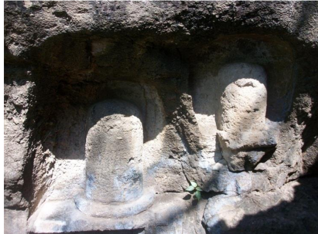
Gambar 3.2. Pahatan relief bentuk Lingga (Dokumentasi: Sulfahri, 19 Mei 2019)

Bentuk pada relief patung lingga hampir sama dengan bentuk-bentuk patung lingga pada umumnya yang terdapat di daerah lain, tidak banyak ornamen yang terlihat, hanya bentuk lingkaran yang mengelilingi kaki dari patung lingga dan hiasan berbentuk pahatan persegi yang ada pada dasar patung tersebut. Relief patung lingga ini memiliki diameter 30 cm dengan tinggi 62 cm. Diukir menggunakan batu andesit dengan menggunakan tehnik pahat. Areal lokasi ini memiliki jarak yang sangat dekat dengan laut yakni hanya berjarak 3 M dari permukaan air laut