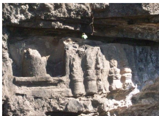
Gambar 3.2. Pahatan relief bentuk Pilar (Dokumentasi: Sulfahri, 19 Mei 2019)

Bentuk relief pilar ini mendominasi situs Wadu Pa'a I dimana pada dasarnya memiliki bentuk dasar yang sama secara keseluruhan. Memiliki pola dasar selinder berbentuk pilar yang disusun