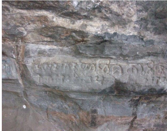
Gambar3.4. Pahatan relief bentuk tulisan Prasasti Jawa Kuno (Dokumentasi: Sulfahri, 19 Mei 2019)