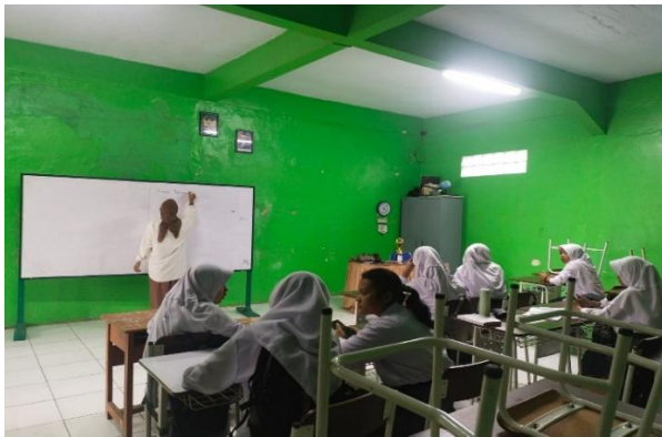
Gambar 1. Kumpulan Rutin FPSH-HAM SMAN 1 Batujajar