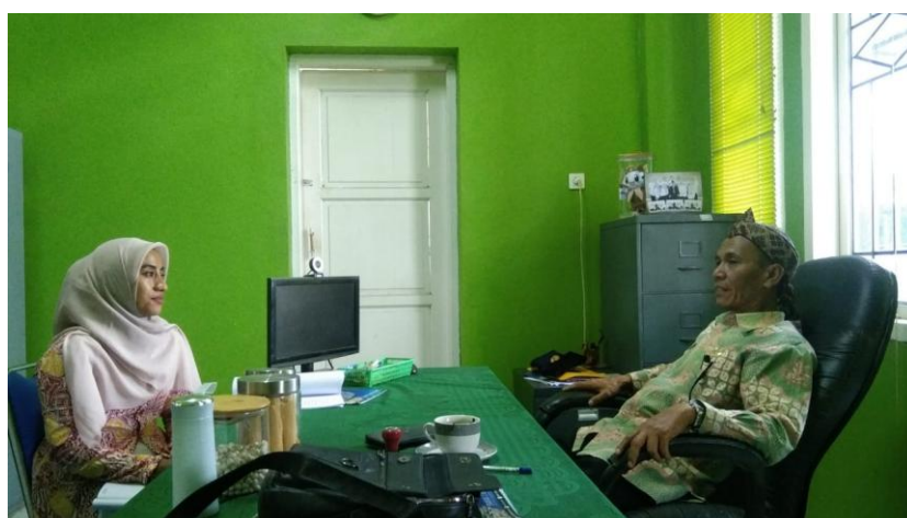
Gambar 3. Wawancara terkait dukungan dari Kepala SMAN 1 Batujajar

Terkait sejauh mana FPSH-HAM di SMAN 1 Batujajar berkontribusi dalam menumbuhkan karakter kepemimpinan berintegritas pada anggotanya, ditemui hasil penelitian terkait karakter kepemimpinan yang dapat terlihat salah satunya dari kedisiplinan peserta didik, utamanya FPSH-HAM SMAN 1 Batujajar memiliki kerjasama dengan OSIS dan Kepeserta didikan dalam program patuh dan disiplin tata tertib sekolah, yang dilakukan setiap pagi di depan gerbang sekolah, untuk mengecek kelengkapan atribut, kerapihan seragam para rekan atau peserta didik sebagai bentuk upaya membiasakan diri mereka memasuki kawasan berintegritas yang secara tidak langsung membentuk karakter yang baik baik itu tanggung jawab, disiplin dan lainnya. Hal ini dapat dilihat pada gambar 3 dibawah ini.