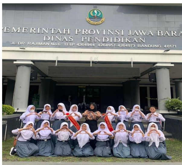
Gambar 4. Kick of Meeting FPSH-HAM Se-Jawa Barat

Berkaitan dengan hal diatas, maka peneliti mendapatkan hasil penelitian dari Kepala SMAN 1 Batujajar terkait adakah rencana pengembangan lebih lanjut untuk program FPSH-HAM SMAN 1 Batujajar di masa mendatang yang dapat dipahami kehadiran FPSH-HAM beserta para anggota yang di munculkan sebagai Duta Hukum dan HAM sebagai upaya sekolah hadir dalam lingkungan sekolah untuk memberikan dukungan dalam penegakan kesadaran hukum dan hak asasi manusia, beserta perannya yang dikemas dalam program-program yang diketahui dan didukung oleh sekolah, tentunya hal ini menjadi langkah pasti dalam membantu peran sekolah untuk menumbuhkembangkan karakter kepemimpinan berintegritas yang menjadi kebiasaan positif yang diperlihatkan, dibiasakan, diajarkan dan kebiasaan dalam hal baik. Berdasarkan penjelasan tersebut sesuai dengan yang diungkapkan oleh (Hendrawan, 2020) bahwa “keberadaan pemimpin itu selalu ada di tengah-tengah kelompoknya (anak buah, bawahan, rakyat)”. Kemudian dipertegas oleh Richards & Eagle, dalam Yuki: 1998 (dalam Hendrawan, 2020) menyatakan bahwa kepemimpinan adalah cara mengartikulasikan visi, mewujudkan nilai dan menciptakan lingkungan guna mencapai sesuatu”. Oleh karena itu menurutnya, seorang pemimpin itu adalah yang dapat merumuskan dan mencapai visi yang telah ditetapkan. Hal ini dapat dilihat pada gambar 4 dan gambar 5 dibawah ini.