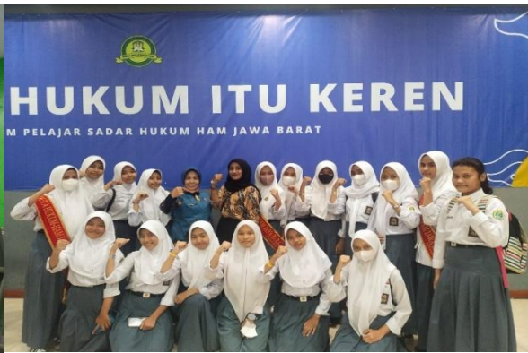
Gambar 2. Kick Off dan General Meetin FPSH-HAM se-Jawa Barat

Kesadaran hukum merupakan suatu esensial yang perlu dimiliki oleh setiap warga Negara demi terciptanya kehidupan yang tentram dan berkeadilan. Sebagaimana para anggota FPSH-HAM SMAN 1 Batujajar termotivasi untuk bergabung didalamnya, selain pemahaman kesadaran hukum dan HAM serta pembentukan karakter berintegritas yang menjadi amanat dari Misi FPSH-HAM Jawa Barat, dalam hal ini para anggota setidaknya sudah menemukan dan memiliki kesadaran diri untuk memiliki pemahaman terkait kesadaran hukum ( Civic Engagement ) sebagai bentuk wujud partisipasi, kegiatan sosial dan advokasi untuk disebarluaskan kepada masyarakat sekaligus sebagai Community Leader , menurut (Soekanto, 1977) berpendapat bahwa “kesadaran hukum merupakan kesadaran atau nilai-nilai yang terdapat di dalam diri manusia tentang hukum yang ada atau tentang hukum yang diharapkan”. Indonesia sebagai Negara hukum menjadikan hukum sebagai aturan dalam kehidupan bersama dan dijadikan sebagai pondasi untuk mengatasi setiap permasalahan yang terjadi. Rendahnya kesadaran hukum menjadi ancaman bagi kemajuan masa depan bangsa Indonesia.