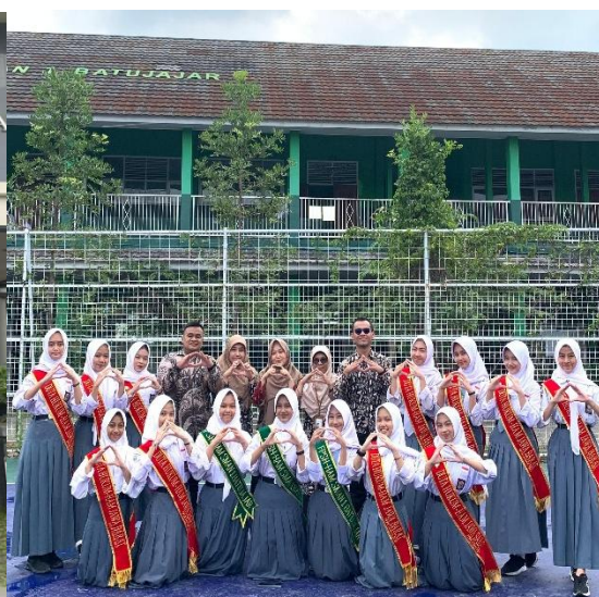
Gambar 5. Dokumentasi FPSH-HAM SMAN 1