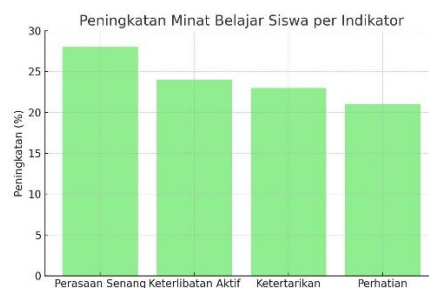
Gambar 2. Grafik Hasil Peningkatan Minat Belajar Siswa

Pada tahap uji coba terbatas yang melibatkan sepuluh siswa, diperoleh respon positif. Sebagian besar siswa menyatakan senang menggunakan media Wordwall karena tampilannya menarik, mudah digunakan, dan berbeda dengan metode pembelajaran sejarah yang biasanya hanya menggunakan ceramah dan buku teks. Umpan balik dari siswa menunjukkan bahwa permainan kuis dan matching games sangat membantu mereka dalam memahami materi karena bersifat kompetitif sekaligus menyenangkan. Setelah dilakukan revisi berdasarkan masukan ahli dan siswa, media kemudian diuji pada uji lapangan yang melibatkan tiga puluh siswa. Hasil angket minat belajar menunjukkan adanya peningkatan yang signifikan. Sebelum penggunaan Wordwall, minat belajar siswa berada pada kategori sedang dengan rata-rata skor 63 dari 100.