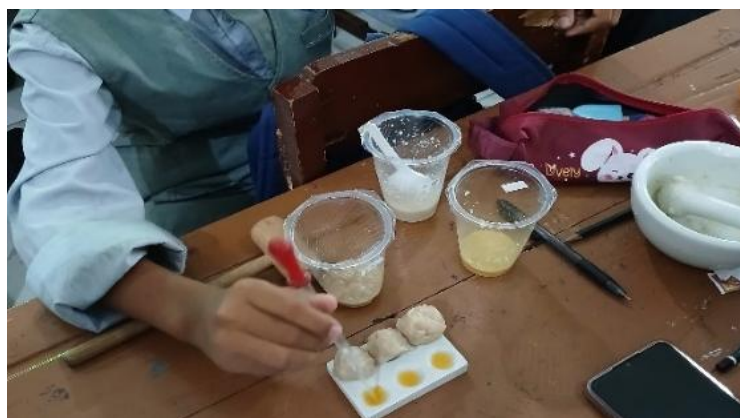
Gambar 1. Aktivitas Murid dalam penyelidikan Uji Boraks

Murid kemudian diberi beberapa pertanyaan diskusi yang relevan dengan permasalahan tersebut, dan dibentuklah kelompok kecil berisi 6-7 anggota. Melalui pembagian LKM dan kegiatan diskusi kelompok, murid diarahkan untuk mengidentifikasi masalah kontekstual yang telah disajikan. Strategi ini tidak hanya merangsang keterlibatan kognitif murid, tetapi juga membangun keterampilan kolaboratif, seperti kemampuan berbagi pengetahuan serta memberi dan menerima kritik (Deswita et al., 2024). Setelah itu, murid diarahkan untuk melakukan penyelidikan uji boraks terhadap beberapa sampel pentol yang dijual di sekitar sekolah. Dokumentasi aktivitas murid saat melakukan penyelidikan uji boraks disajikan pada Gambar 1.