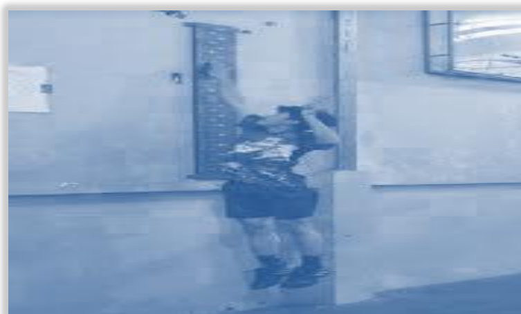
Gambar 2. Pencatatan tinggi lompatan atlet bulu tangkis